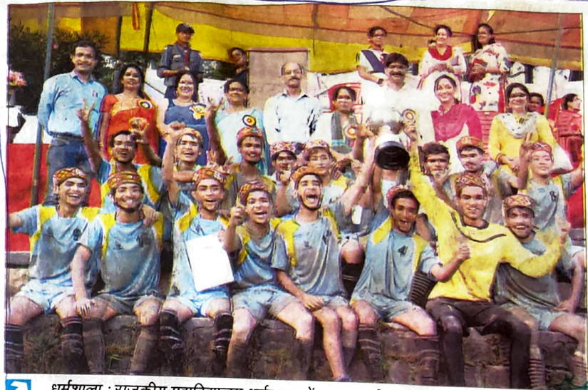
धर्मशाला : राजकीय महाविद्यालय धर्मशाला में राज्य स्तरीय इंटर कालेज फुटबाल प्रतियोगिता के फाइनल मुकाबले में विजेता डिग्री कालेज धर्मशाला की टीम ट्रॉफी के साथ।