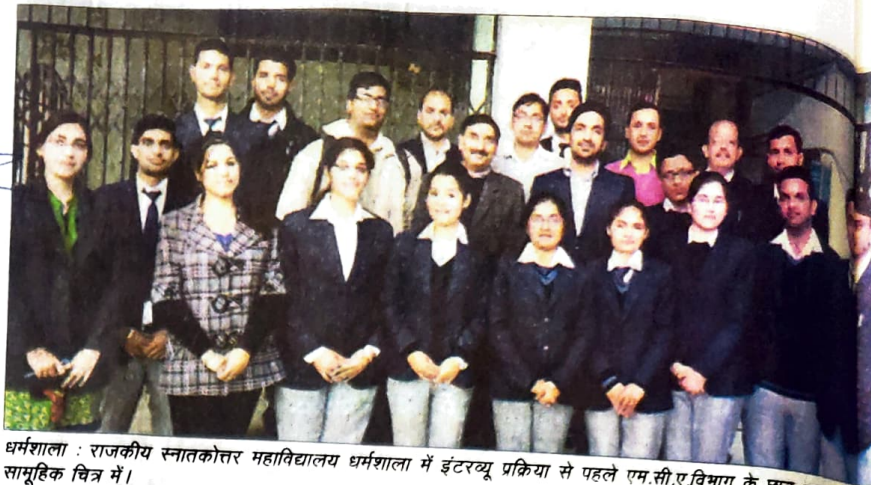
धर्मशाला : राजकीय स्नातकोत्तर महाविद्यालय धर्मशाला में इंटरव्यू प्रक्रिया से पहले एम.सी.ए.विभाग के छात्र अध्ययनकर्ता सामूहिक चित्र में।