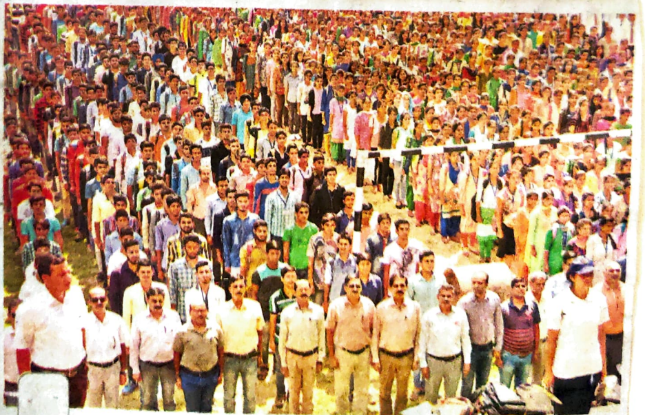
आजादी-70 वर्ष याद करो कुर्बानी कार्यक्रम में डिग्री कॉलेज धर्मशाला में एक साथ राष्ट्रगान करते विद्यार्थी एवं स्टाफ के सदस्य।