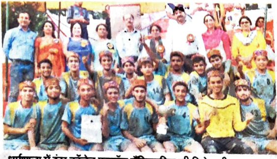
धर्मशाला में इंटर कॉलेज फुटबाल चैम्पियनशिप की विजेता टीम एक साथ।