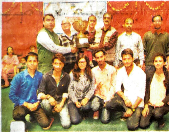
पांगी में आयोजित अंतर महाविद्यालय शतरंज प्रतियोगिता की विजेता टीम आयोजकों के साथ।