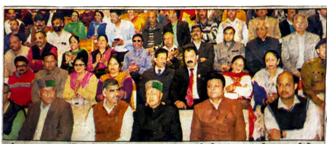
धर्मशाला : मुख्यमंत्री वीरभद्र सिंह के उद्घाटन के दौरान स्वामीय कालेज के नए ऑडिटोरियम में मंत्र पर उपस्थित मुख्यमंत्री वीरभद्र सिंह व अन्य गणप्रधान