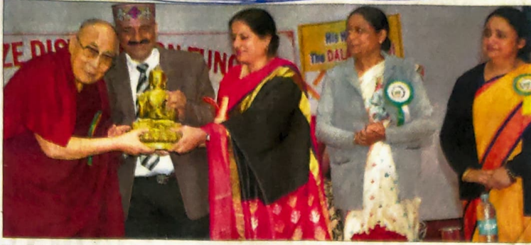
The Dalai Lama receives a memento in Dharamsala on Tuesday.