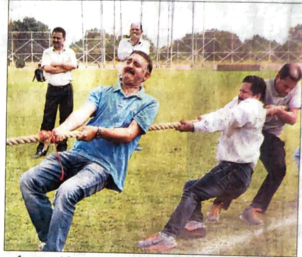
धर्मशाला : प्रोफेसर रस्साकशी प्रतियोगिता में भाग लेते हुए।