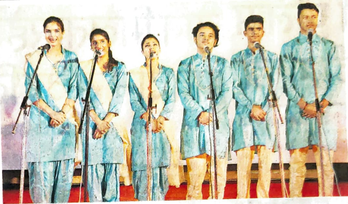
धर्मशाला महाविद्यालय में युवा महोत्सव के दूसरे दिन समूहगीत की प्रस्तुति देते स्थानीय कॉलेज के विद्यार्थी