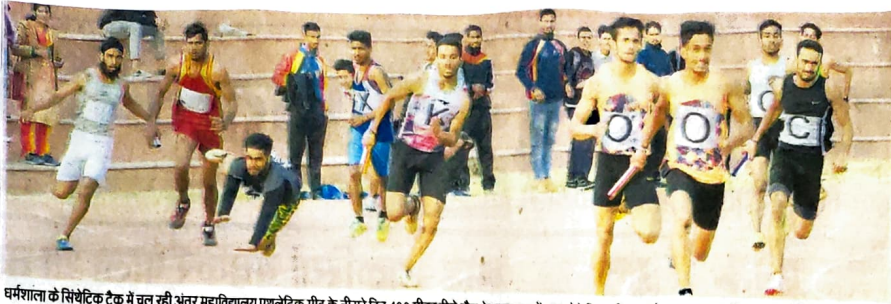
धर्मशाला के सिथेटिक ट्रैक में चल रही अंतर महाविद्यालय एथलेटिक मीट के तीसरे दिन 400 मीटर रीले दौड़ के फाइनल में भाग लेते खिलाड़ी। इस दौरान एक खिलाड़ी गिर गया