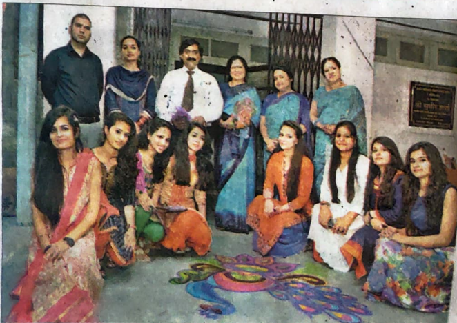
डिग्री कॉलेज धर्मशाला की छात्राओं के जनरल हॉस्टल में आयोजित फ्रेशर पार्टी के लिए बनाई गई रंगोली।