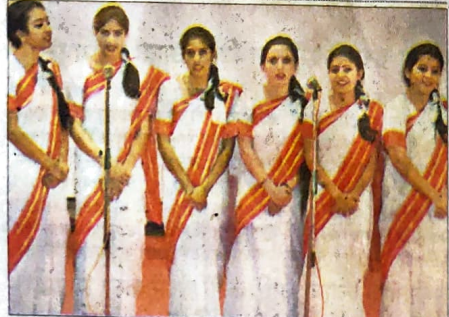
युवा महोत्सव 2017 के शुभारंभ पर सरस्वती वंदना पेश करती छात्राएं।