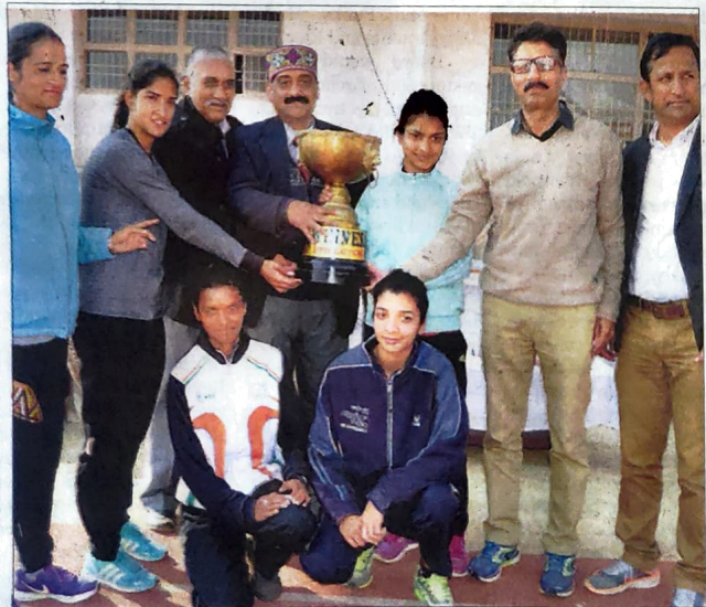
PROUD MOMENT The team of PG College receive the Champions' Trophy from the chief guest during the 43rd annual athletics Championship of HPU Inter College at Dharmshala on Tuesday.