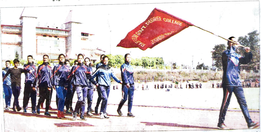
धर्मशाला : सिंथेटिक ट्रैक में मार्चपास्ट की सलामी के दौरान विभिन्न कालेज के प्रतिभागी।