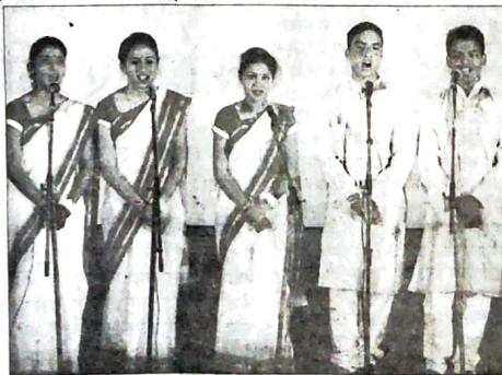
धर्मशाला कॉलेज में चल रहे विश्वविद्यालय स्तरीय युवा महोत्सव 2017 में बुधवार को समूह गायन प्रस्तुत करते जिला मंडी के विद्यार्थी।

दूसरे दिन के पहले सत्र में राजकीय संस्कृत कॉलेज सुंदरनगर ने समूहगान की प्रस्तुति दी। समूहगान प्रतिस्पर्धा में मेजबान कॉलेज धर्मशाला, सरकाघाट, रामपुर, आनी, सीमा, मंडी सहित कुल 26 कॉलेजों में अपनी प्रस्तुति दी। वहीं दूसरे सत्र में लोकगीत