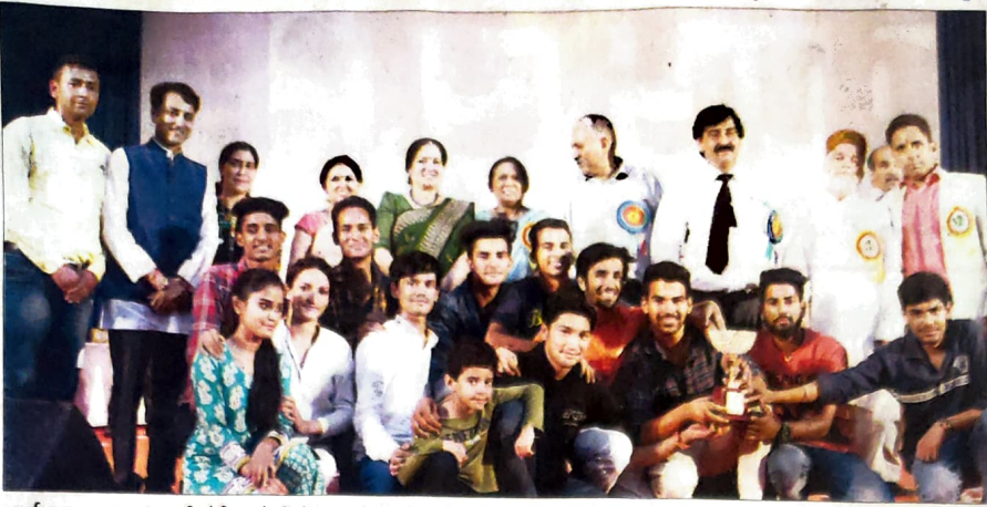
धर्मशाला : वाद्य यंत्र प्रतियोगिता में विजेता आनी कालेज के प्रतिभागी मुख्यातिथि के साथ।