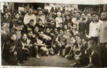
शिमला के संजौली कॉलेज में आयोजित इंटर कॉलेज कबड्डी चैंपियनशिप विजेता टीम को सम्मानित करते मुख्य अतिथि।