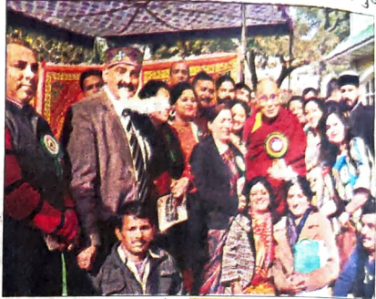
■ स्टाफ रिपोर्टर, धर्मशाला

धर्मशाला कालेज के वार्षिक समारोह के दौरान मुख्यातिथि