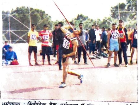
धर्मशाला : सिंथेटिक ट्रैक धर्मशाला में इंटर कॉलेज एथलेटिक मीट के दूसरे दिन जेवलिन थ्रो करते प्रतिभागी।