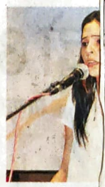
गजल गायी जोगेंद्रनगर कॉलेज