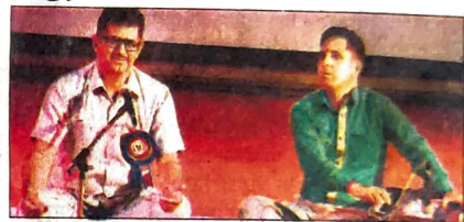
स्टाफ रिपोर्टर, धर्मशाला