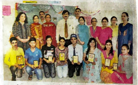
(एफ) धर्मशाला महाविद्यालय में हिंदी दिवस पर आयोजित प्रतियोगिताओं के विजेता प्रतिभागी मुख्या