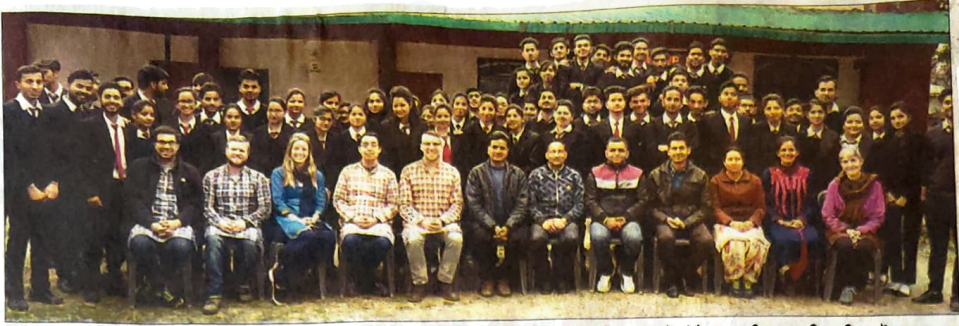
धर्मशाला : कैली बिजनेस स्कूल इंडियाना यूनिवर्सिटी यू.एस.ए. का शिष्टमंडल धर्मशाला महाविद्यालय में प्रोफेसर सहित सामूहिक चित्र में। (नवीन)