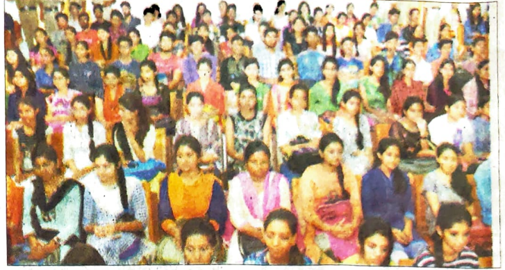
दिल्ली एनसीएसटीसी एवं प्रदेश काउंसिल फॉर साइंस टेक्नोलॉजी एवं पर्यावरण शिमला के तत्वावधान में धर्मशाला कॉलेज सभागार में विज्ञान गतिविधियों पर आयोजित कार्यशाला में भाग लेते विद्यार्थी।