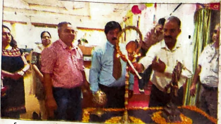
धर्मशाला : धर्मशाला कालेज में ओरिएंटेशन प्रोग्राम में मौजूद एम.बी.ए. के विद्यार्थी व अन्य।