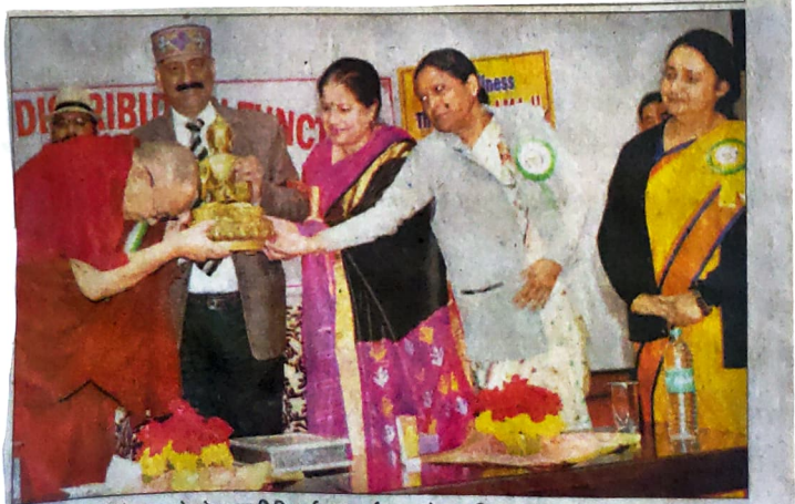
धर्मशाला कॉलेज समारोह के मुख्यातिथि धर्मगुरु दलाईलामा को सम्मानित करते हुए। (संबंधित खबर पेज 5 पर)