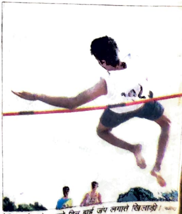
धर्मशाला : सिंथेटिक ट्रैक में इंटर कॉलेज एथलेटिक मीट के दूसरे दिन छाई जप लगाते खिलाड़ी।