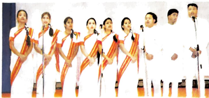
धर्मशाला महाविद्यालय में हिमाचल प्रदेश विश्वविद्यालय के युवा महोत्सव ग्रुप दो के शुभारंभ पर सरस्वती वेदना की प्रस्तुति देने विद्यार्थी • जागरण

मंगलवार को पहले सत्र में शास्त्रीय संगीत, हिंदुस्तानी और कर्नाटक शैली पर 15 कॉलेजों के प्रतिभागियों ने प्रस्तुतियां दीं। पीजी सेंटर शिमला को प्रस्तुति को दर्शकों ने खूब सराहा तो जोगेंद्रनगर कॉलेज ने भी वाहवाही लूटी। मंगलवार को संस्कृत कॉलेज सुंदरनगर, कोटशेरा, हरिपुर, मनाली, फाइन आर्ट्स कॉलेज शिमला, करसोग, आरकेएमवी शिमला, जीसी सोलन, पीजी सेंटर शिमला, हमीरपुर कॉलेज, चंबा, जोगेंद्रनगर, धुरल