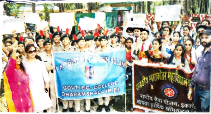
धर्मशाला महाविद्यालय के एनएसएस स्वयंसेवी और एनसीसी कैडेट्स स्वच्छता जागरूकता रैली निकालते हुए • जागरण

धर्मशाला महाविद्यालय के एनसीसी कैडेट्स और एनएसएस स्वयंसेवियों ने निकाली रैली