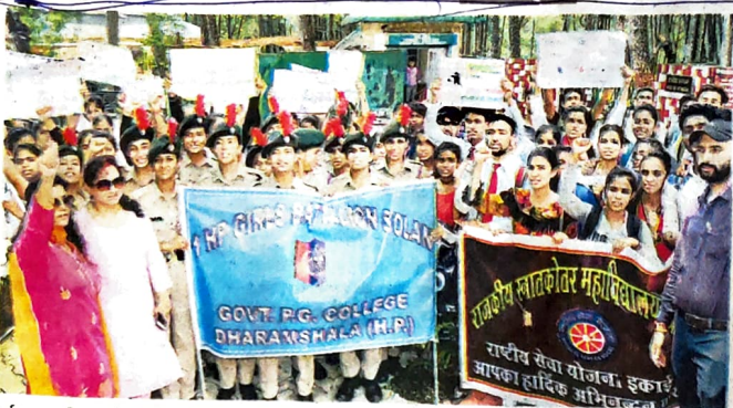
धर्मशाला महाविद्यालय के एनएसएस स्वयंसेवी और एनसीसी कैडेट्स स्वच्छता जागरूकता रैली निकालते हुए • जागरण

धर्मशाला महाविद्यालय के एनसीसी कैडेट्स और एनएसएस स्वयंसेवियों ने निकाली रैली