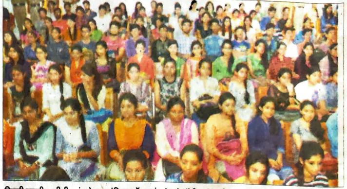
दिल्ली एनसीएसटीसी एवं प्रदेश काउंसिल फॉर साइंस टेक्नोलॉजी एवं पर्यावरण शिमला के तत्वावधान में धर्मशाला कॉलेज सभागार में विज्ञान गतिविधियों पर आयोजित कार्यशाला में भाग लेते विद्यार्थी।