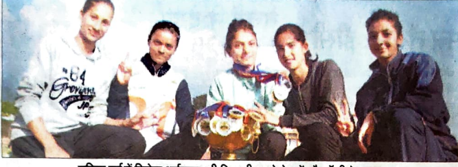
महिला वर्ग में विजेता धर्मशाला की खिलाड़ी अपने मेडलों और ट्रॉफी के साथ।