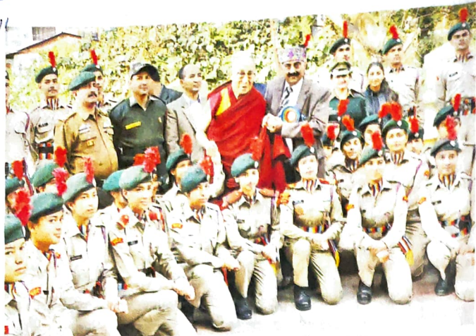
धर्मशाला कॉलेज के वार्षिक समारोह के दौरान एनसीसी कैडेट्स के साथ तिब्बती धर्मगुरु दलाईलामा