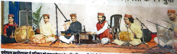
धर्मशाला महाविद्यालय में शनिवार को युवा महोत्सव के अंतिम दिन प्रस्तुति देते पीजी सेंटर शिमला के प्रतिभागी • जगन्नाथ

पीजी सेंटर सेंटर शिमला की 11 सदस्यीय युवा वाद्य वृंद टीम ने बांसुरी, तबलक अखिल कुमार की अगुवाई में विभिन्न जिलों की संस्कृति से रूबरू