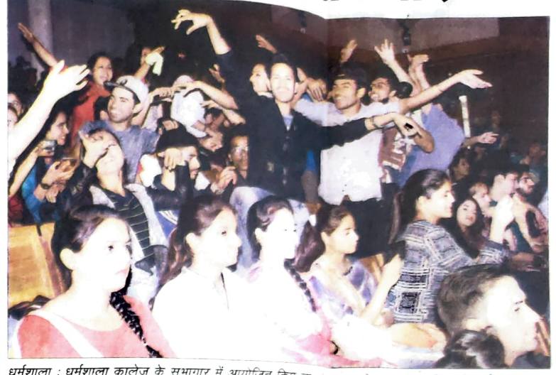
धर्मशाला : धर्मशाला कालेज के सभागार में आयोजित किए जा रहे युवा महोत्सव युप-2 में झूमते दर्शक।