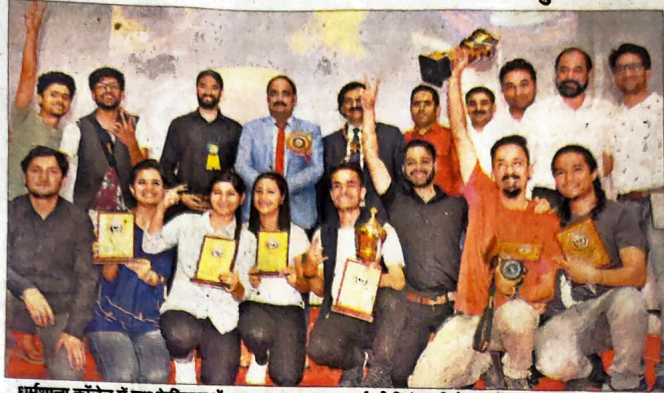
धर्मशाला कॉलेज में युवा फेस्टिवल में पारचात्य समूहगान स्पर्धा की विजेता पीजी सेंटर शिमला की टीम।

पारचात्य गायन में फाइन आर्ट कॉलेज शिमला, तबला वादन में सुंदरनगर प्रथम।