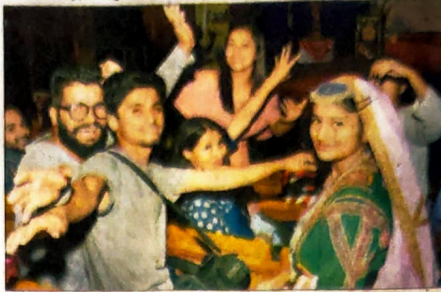
धर्मशाला में प्रस्तुति देना शुभम और हिमाचली लोकगीतों पर झूमने विद्यार्थी।