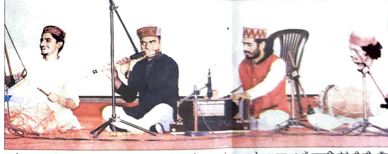
धर्मशाला : धर्मशाला कालेज के सभागार में आयोजित किए जा रहे युवा महोत्सव युप-2 में प्रस्तुति देने पी.जी. सेंटर शिमला के प्रतिभागी।