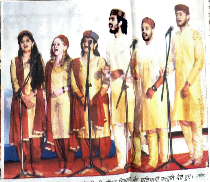
धर्मशाला : धर्मशाला कालेज के सभागार में आयोजित किए जा रहे युवा महोत्सव गुप-2 के दौरान प्रस्तुतियों का आनंद लेते विद्यार्थी व अन्य अधिकारी तथा (दाएं) पी.जी. सेंटर शिमला के प्रतिभागी प्रस्तुति देते हुए। (लेफ्ट)

उम्माद बधा स्वरूप में का पहाड़ कं गायन भले हिमाचल प्र महोत्सव गुप में इस संस् की गायको व हारमोन गीतों के सु हिमाचल के धा। सभाग कभी यं