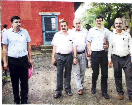
धर्मशाला महाविद्यालय में एमएससी और एमकॉम की कक्षाएं शुरू करने के लिए व्यवस्था का निरीक्षण करती हिमाचल प्रदेश विश्वविद्यालय की टीम

हालांकि फैसला धर्मशाला कॉलेज के पक्ष में होता है या नहीं यह तो निरीक्षण टीम की रिपोर्ट के आधार पर ही कुलपति लेंगे। राजकीय स्नातकोत्तर महाविद्यालय धर्मशाला में तीन नए कोर्स एमएससी केमिस्ट्री, जियोग्राफी व एमकॉम शुरू किए जाने को लेकर विश्वविद्यालय के कुलपति ने पांच सदस्यीय निरीक्षण टीम को गठन किया था।