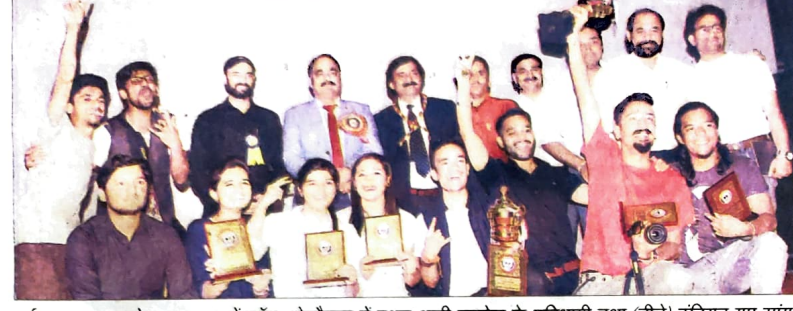
धर्मशाला : युवा महोत्सव युप-2 में फॉक ओरकेस्ट्रा में प्रथम आनी कालेज के प्रतिभागी तथा (नीचे) इंडियन युप सांग में प्रथम स्थान प्राप्त करने वाले पी.जी. सेंटर शिमला के प्रतिभागी टॉफी के साथ।