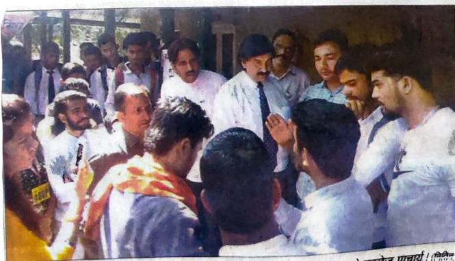
धर्मशाला : अखिल भारतीय विद्यार्थी परिषद के कार्यकर्ताओं की मांगों को सुनते कालेज प्राचार्य।