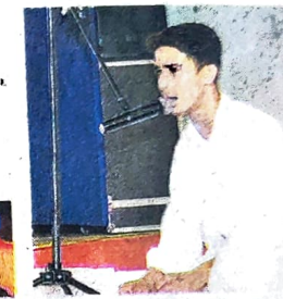
युवा महोत्सव दो के पहले दिन शास्त्रीय संगीत गायन प्रतियोगिता में प्रस्तुति देते प्रतिभागी।

इन कॉलेजों के प्रतिभागियों ने दी प्रस्तुति राजकीय महाविद्यालय दलिया, सोलन, कोटशेरा, पीजी सेंटर हिमाचल प्रदेश विश्वविद्यालय शिमला, क्यारटू, आरकेएमवी शिमला, ऊना, करसोग, हमीरपुर, जोगेन्द्रनगर, जेएलएस फाइन आर्ट्स कॉलेज शिमला, सजोली व भटोली महाविद्यालय के प्रतिभागियों ने प्रस्तुति दी।