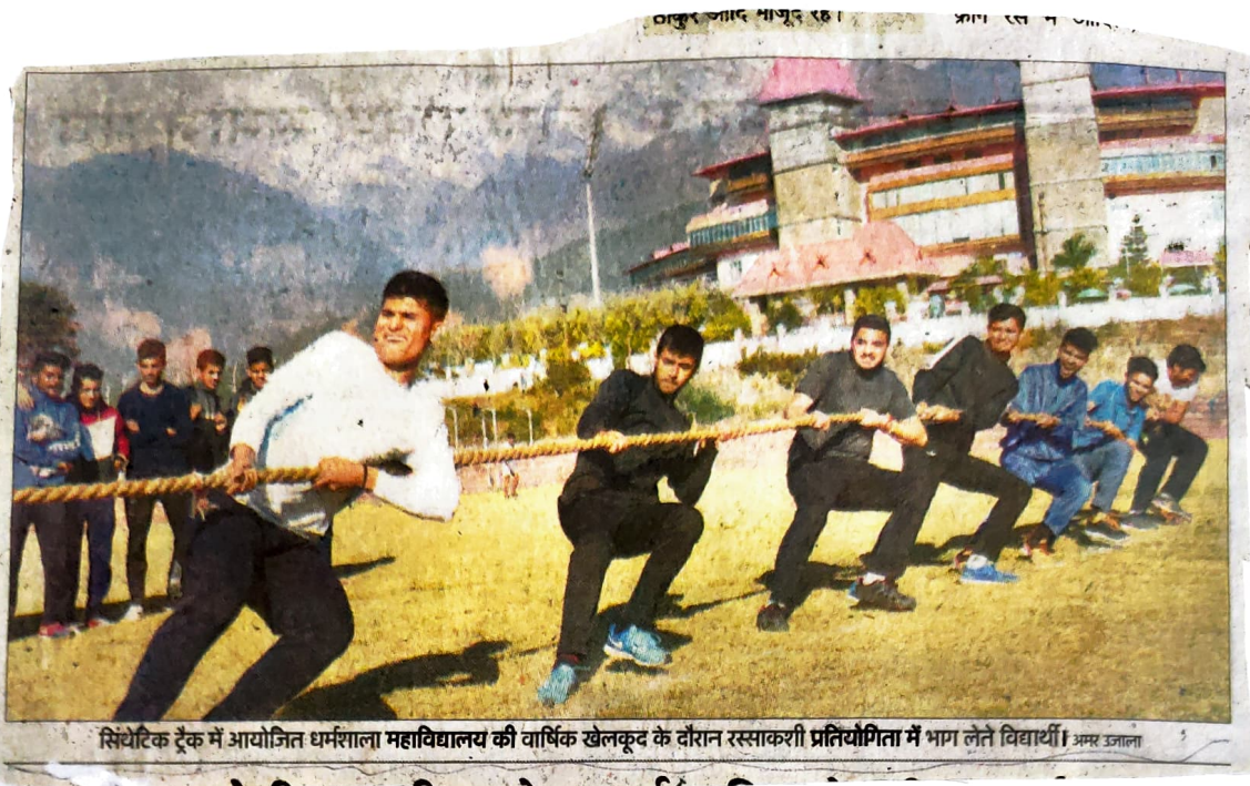
सिंथेटिक ट्रैक में आयोजित धर्मशाला महाविद्यालय की वार्षिक खेलकूद के दौरान रस्साकशी प्रतियोगिता में भाग लेते विद्यार्थी।