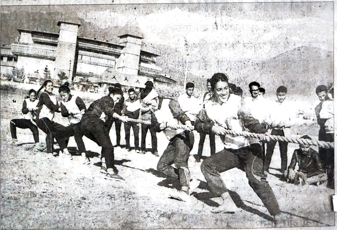
सिंथेटिक ट्रैक धर्मशाला में वार्षिक खेलकूद प्रतियोगिता में भाग लेती धर्मशाला कॉलेज की छात्राएं।