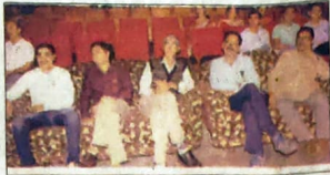
धर्मशाला : राजकीय महाविद्यालय धर्मशाला के सभागार में कार्यक्रम के दौरान उपस्थित प्रोफेसर।