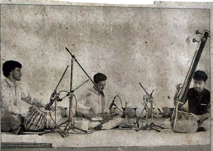
धर्मशाला महाविद्यालय में आयोजित यूथ फेस्टिवल में शास्त्रीय संगीत स्पर्धा में प्रस्तुति देते कलाकार । अमर उजाला

एक प्रस्तुतियां पेश कीं। शास्त्रीय संगीत में सोलन, डलियापा, कोटशेरा, पीजी सेंटर शिमला, संस्कृत कॉलेज कटारू, आरकेएमवी शिमला, ऊना, करसोग, हमीरपुर, जोगिंद्रनगर, फाइन आर्ट्स कॉलेज शिमला और भटौली कॉलेज के प्रतिभागियों ने प्रस्तुतियां दीं। वहीं, तबला वादन में आठ कॉलेज के प्रतिभागियों ने भाग लिया। इसमें जोगिंद्रनगर, सुंदरनगर, फाइन आर्ट्स शिमला, बेजनाथ, कुल्लू, बासा, भटौली और टियोग कॉलेज शामिल हैं।