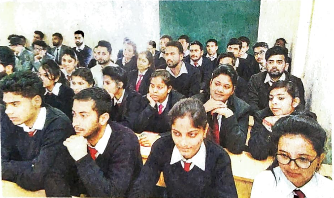
दैनिक जागरण की ओर से धर्मशाला कॉलेज में ट्रेफिक जागरूकता पर आयोजित कार्यक्रम में उपस्थित विद्यार्थी