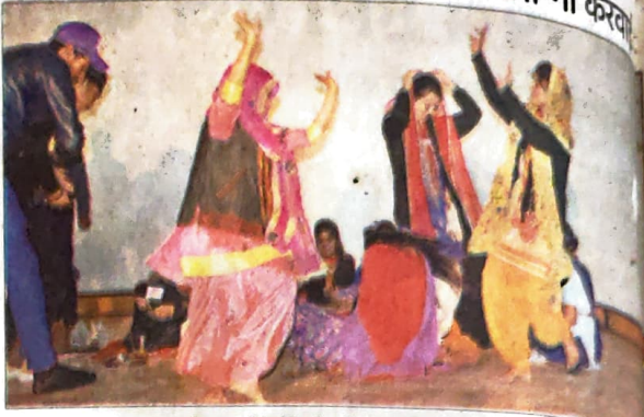
धर्मशाला कॉलेज में सांस्कृतिक प्रस्तुति देते स्काउट्स एंड गाइड।